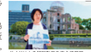
ガイドによる解説動画を交えて学習

オンライン上でしたが、広島について、被爆について、より近くに感じ、学ぶことができました。