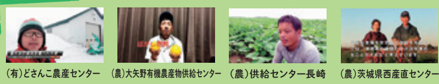
(有)どさんこ農産センター (農)大矢野有機農産物供給センター (農)供給センター長崎 (農)茨城県西産直センター