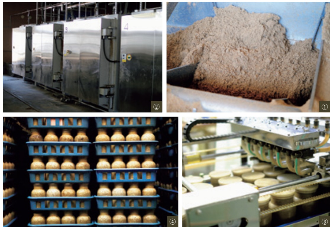
①培地作り ②殺菌釜で殺菌 ③接種の様子 ④培養室で菌糸を培養