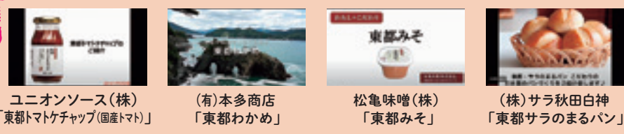
ユニオンソー司(株)「東都トマトケチャップ(国産トマト)」 (有)本多商店「東都わかめ」 松電味噌(株)「東都みそ」 (株)サラ秋田白神「東都サラのまるパン」

プライベートブランド わたしのこだわり おいしさの理由 商品がどのように作られるか、メーカーが何にこだわっているかが分かります。