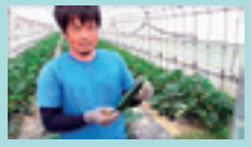
(農)房総食料センター

東都生協公式チャンネル https://www.youtube.com/c/tohtocoop-official