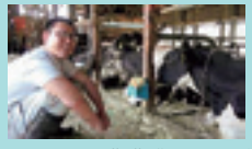
千葉北部酪農農業協同組合