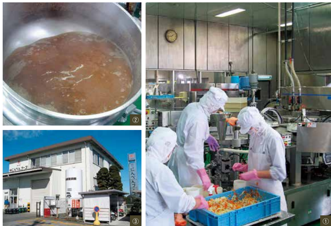
①「東都惣菜屋さん 五目きんぴら」充填作業の様子。最後 は人の目と手で確かめます。②丁寧にひいた本格派の「だ し」③株式会社になべんフーズ焼津工場