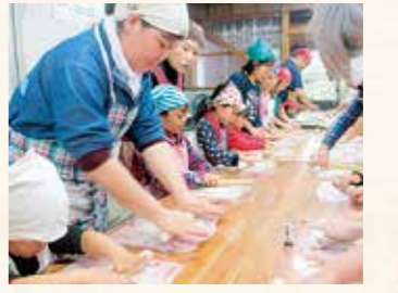
みんなでピザ作り (11/23)