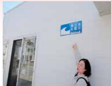
石巻市復興まちづくり情報交流館にて