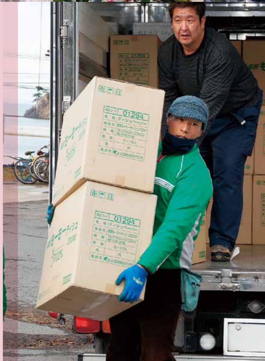
写真上: (農) 埼玉産直センターでの雪害復興支援 (2014年4月) 写真右: 宮城県石巻市表浜炊き出し支援 (2013年12月)