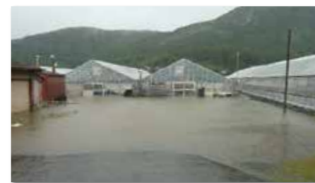
冠水したヒールハウス(茨城県JAやまもと)

2015年9月9日未明から11日にかけての台風18号に伴う記録的な豪雨は、関東・東北地方を中心に大変な被害をもたらしました。東都生協は直ちに支援募金に取り組み、被災した産地や取引先の支援に、また日本生活協同組合連合会を通じて被災地域の支援に活用しました。