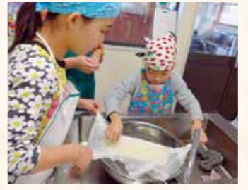
豆腐作り。固まったかな? (12/19)

で育てた大豆は無事に収穫ができ、最終回にはこの大豆で豆腐を作りました。 参加者からは「8月の草取りは暑くて大変だったが、生産者はこの中で作業していることを痛感した」「貴重な体験ができた。この企画に参加して東都生協で野菜を注文するようになり、野菜を食べる量も増えた」と感慨深い声が聞かれました。