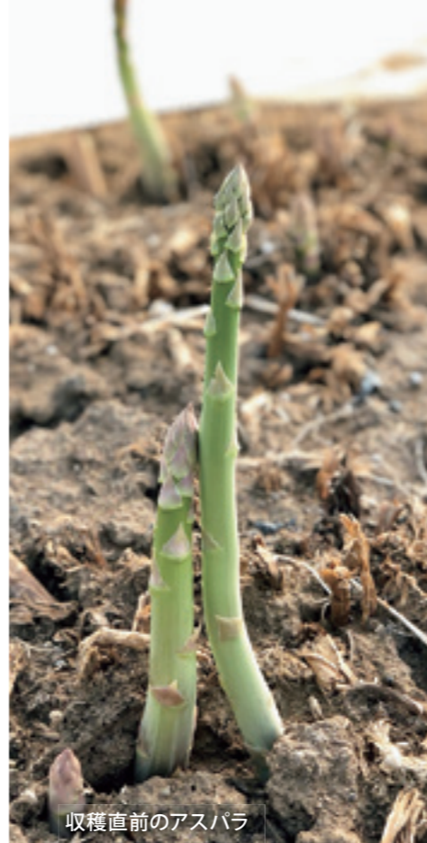
収穫直前のアスパラ

グリーンアスパラは、強い生命力を持つ野菜で栄養価が高いことでも知られます。カロテン、ビタミンB群、ビタミンCのほか、穂先には「アスパラギン酸」が含まれています。これから夏にかけての健康野菜としてもおすすめです。