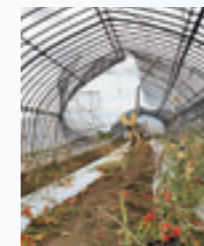
2019年の台風15号では大きな被害が

地球温暖化の影響はとて大きな問題です。野菜では病虫害の発生や生育の問題があります。例えば、暖冬。本来は冬の厳しい寒さで減る害虫が年を越して活動し、被害は拡大する一方です。また、冬の葉物野菜はじっくり育つと良い出来になります。今後、この異常気象が続く、あるいは進んでいくと今作っている野菜が作れなくなる可能性もあります。さらに、農家がこれまで培ってきた長年の経験が通用しなくなっていくことに不安を感じますが、組合員の皆さんのために、日々努力を怠らず作り続けていきます。