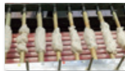
個性豊かな作品ができました