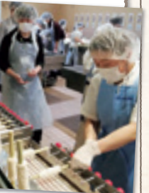
広く清潔な会場で手作りに初挑戦

慶応元年創業の歴史ある「鈴廣かまぼこ」は、天然素材を使い、うま味調味料は不使用、保存料も無添加。伝統的な製法を守りつつ環境にも配慮した経営をしています。