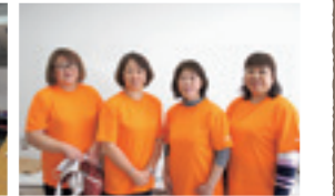
枝幸漁協女性部の皆さん