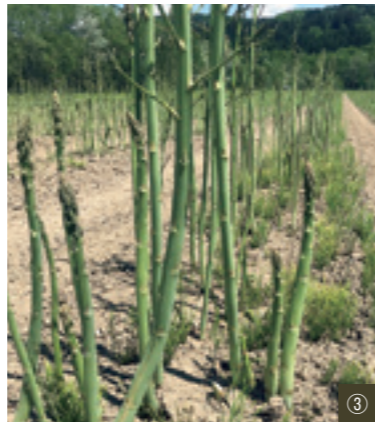
① 広大なアスパラ農場(収穫前) ② 虫にアスパラを食べられないように、あえて雑草を残し、そちらに誘導します ③ 昨年天候不順で一気にピークを迎え、収穫しきれず伸びたアスパラ ④ 選別作業風景