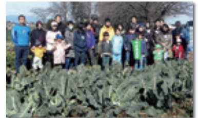
今回の連続企画に参加した皆さん

「子どもたちに土に触れる体験をさせたかった」「親子で農業経験したい」「3歳の息子に野菜の成長の仕方を聞かれ、それを知りたくて親子で参加」「おいしい野菜を好きになってくれたら」と参加の動機はさまざま。でも、「楽しかった!」「安心と満腹を味わえた!」「温かい気持ちになれて、参加して良かった!」などの声があり、生産者の汗と涙の結果が、私たちに届く「産地直結」のおいしい安全な野菜であることを実感しました。