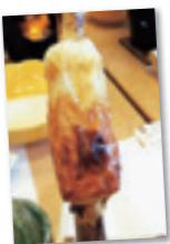
出来立てアツアツの焼きちくわ

苦八苦しましたが、自分で作ったかまぼこの味はまた格別。鈴廣かまぼこのこだわりや、本物のかまぼこのおいしさを味わい大満足の訪問となりました。