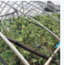
2019年の台風15号によりハウスや作物に被害

昨今、毎年のように記録的な気象災害が地球規模で発生しています。人間が化石エネルギーに依存し過ぎた結果が、地球温暖化を招いているという話をよく聞きます。わが家ではレタスを栽培しています。自然災害による被害に遭わないための対策として、人工栽培に切り替えることも一つの方法ですが、食べ物は自然環境の中で栽培するのが「人間には一番合っている」と考えています。ただ、集中豪雨や長雨が続きと傷みやすくなり、限度を超えた気温が続くと何らかの異常につながります。その時は、せっかく作ったレタスを諦めるしかありません。リスクを回避するために、作付地を分散する、排水良好な圃場(作物を栽培する田畑)を作る、適性施肥、強風対策、品種の選定などの耕種的予防を総合的に実施しています。こうした対応をするだけでも予防効果は大きいと思っています。