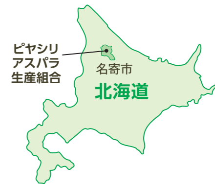
ピヤシリアスバラ生産組合

昨年の夏、同産地では気温の高い日が続いて収穫のピークが早まり、一気に育ったアスパラを収穫しきれませんでした。このように天候の影響を受けやすいという苦勞のほか、他産地と同様、収穫作業での人手不足も深刻ですが、生産者たちは力を合わせておいしいアスパラを育てています。