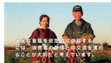
行っかつもりで産地訪問