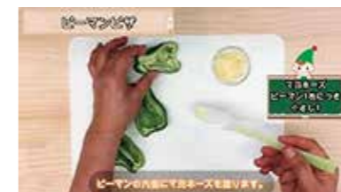
行っかつもりで料理教室