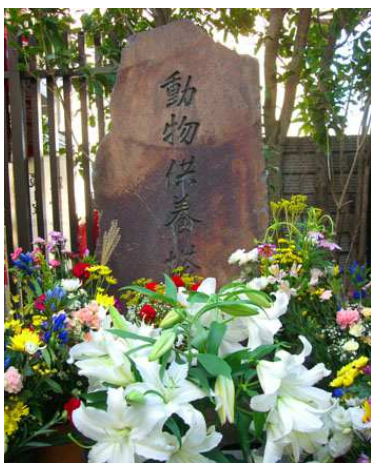
提携先：多摩犬猫霊園