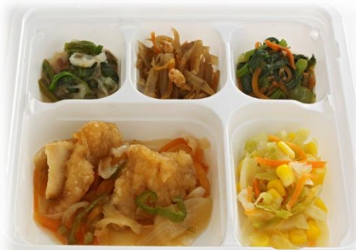
鶏肉と野菜の南蛮漬け