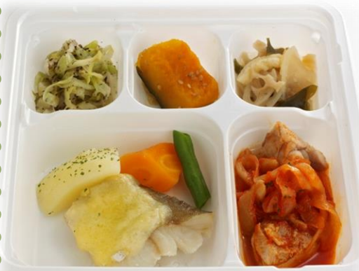
タラのチーズ焼き